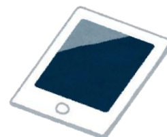
電子図書館体験会

今年4月から新しくはじまった電子図書館のサービスをはじめ、新たな図書館の魅力をご案内します。英語のナレーション付きの電子書籍を使用したおはなし会や、iPadを使った電子図書館体験会、輪投げ遊び、ガチャガチャなどもあります。おはなし会の対象は幼児～小学校低学年。電子図書館体験会は、どなたでも参加できます。